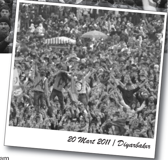
20 Mart 2011 | Diyarbakır

Platformdan, Asrın Hukuk Bürosu imzasıyla Abdullah Öcalan’ın mesajı okundu. Newroz kutlaması Kürtçe parçalar eşliğinde çekilen coşkulu halaylarla